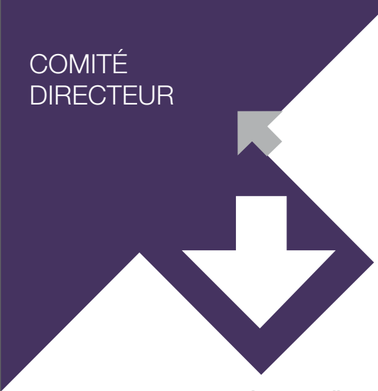
Les 4 co-directeurs des programmes MRHC