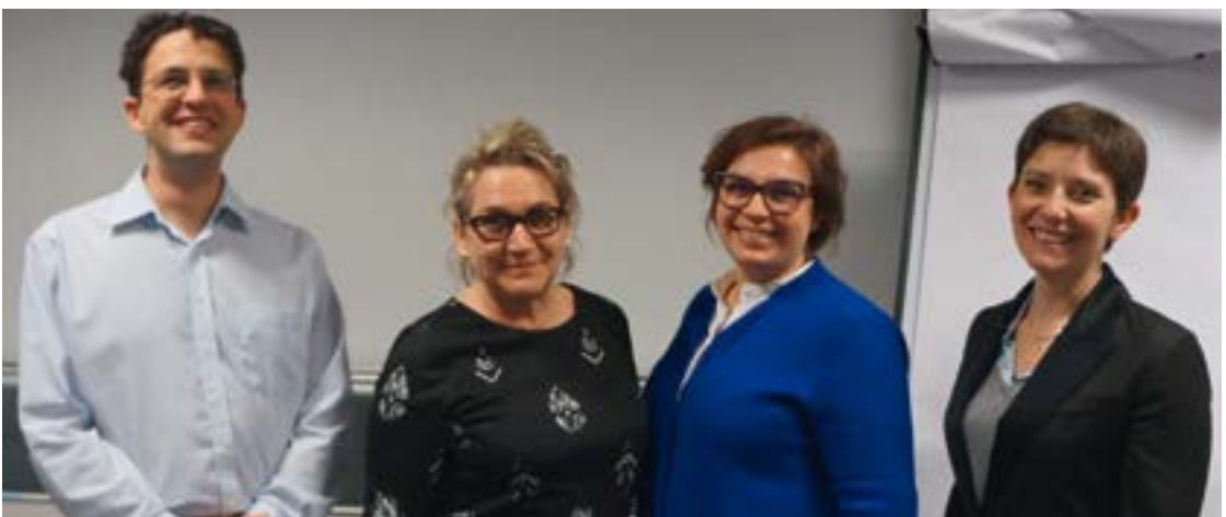
Expert-e-s intervenant dans le cadre du M1 «Environnement des organisations»